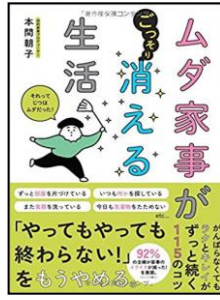
「ムダ家事が消える生活」 本間朝子 著 サンクチュアリ出版