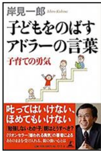
「子どもをのばす アドラーの言葉」 岸見一郎 著 幻冬舎

男女共同参画センターでは、図書の貸出を行っております。貸出は、1回につき、1人2冊、2週間までです。