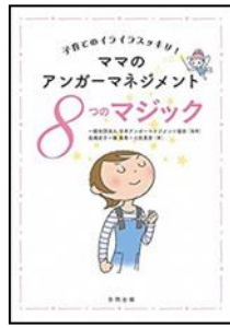
「ママのアンガーマネジ メント 8つのマジック」 日本アンガーマネジメント協会 合同出版