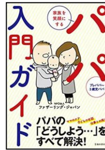
「家族を笑顔にする パパ入門ガイド」 ファザーリング・ジャパン 著 池田書房